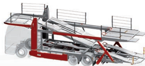
supertrans® Typ B5